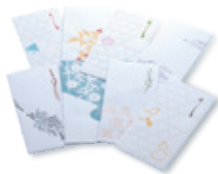
手摺り木版画祝儀袋