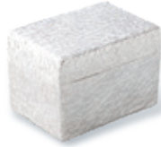
銀罎箱 ぎんかばこ