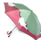
ほぐし織りねこ折傘